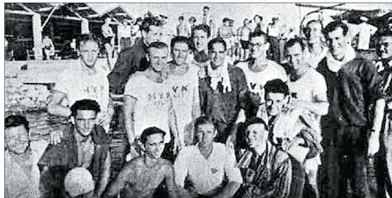
La squadra dell'HVK a Sebenico nel 1937