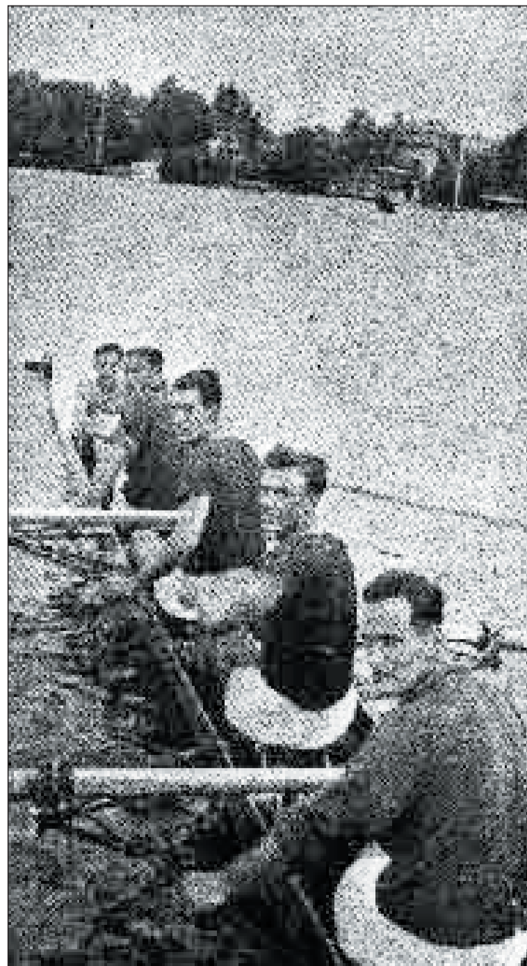
Il quattro con agli europei del 1935