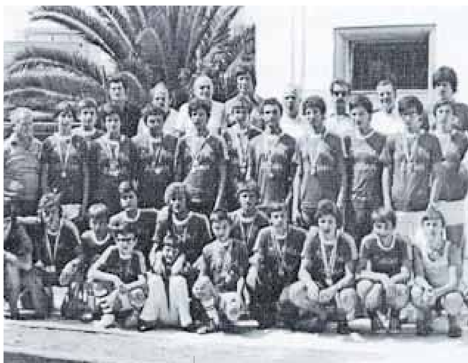
Una foto di gruppo della squadra juniores ai campionati jugoslavi del 1977