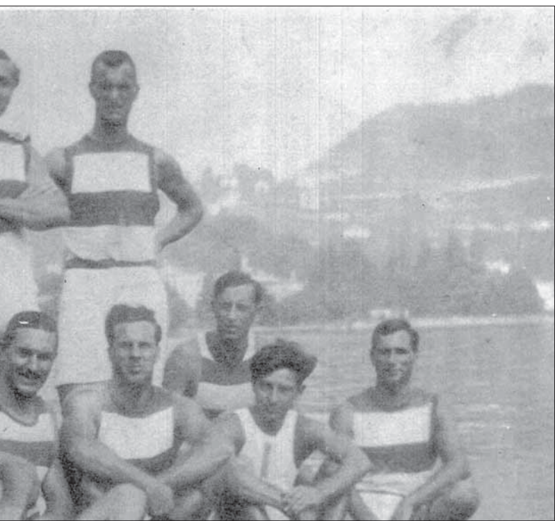
seniores vincitore del primo titolo italiano