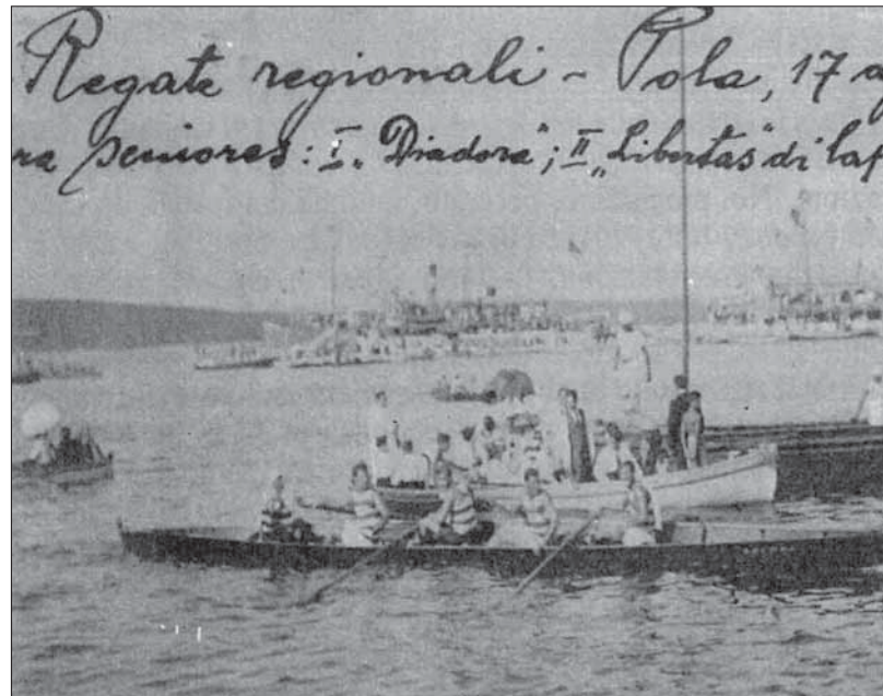
Campionato regionale del 1919