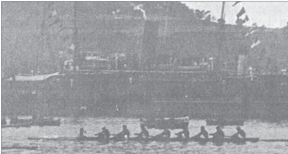
L'equipaggio della Diadora vicecampione europeo del 1922 a Barcellona