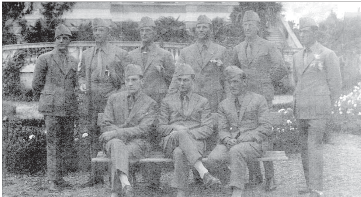
I vincitori della medaglia di bronzo alle Olimpiadi del 1924

OLIMPIADI, UN AUTENTICO CALVARIO Di anno in anno i successi del Circolo canottieri Dia-