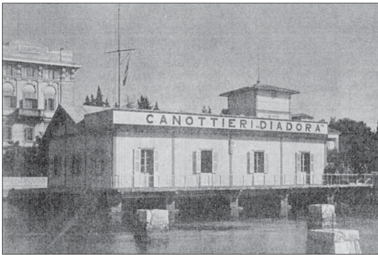
L'ex sede della Diadora a Zara

L'USCITA CANAL GRANDE Per celebrare la risorta Diadora, il 29 settembre 1962, ospiti della vecchia fraterna società Querini, ci fu l'uscita generale in mare. Con i colori della Diadora sul Canal Grande sfilarono due jole a otto, quattro jole a quat-