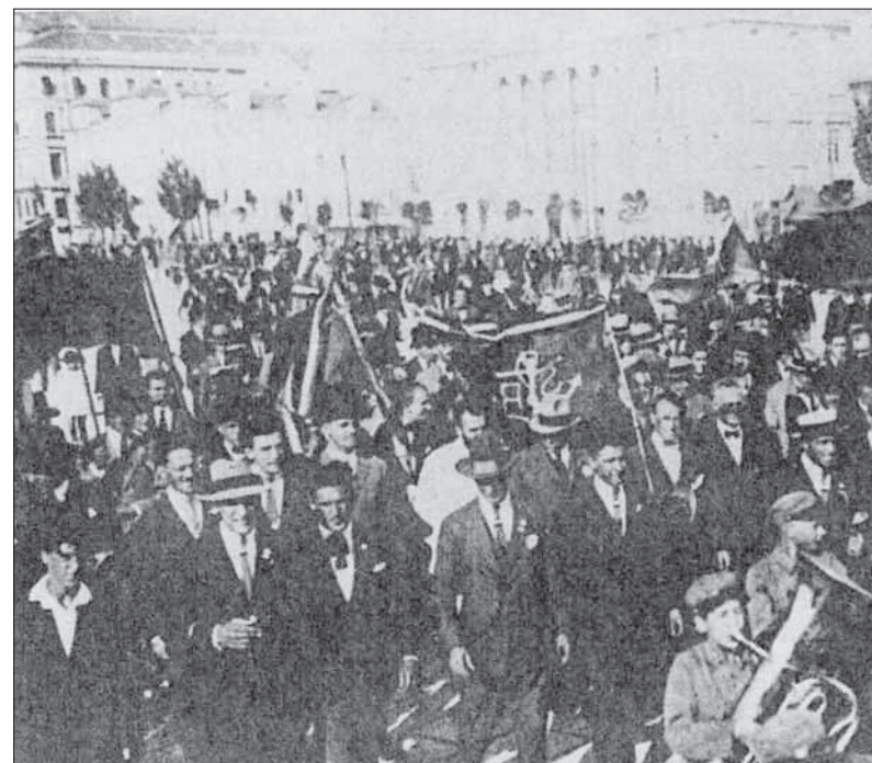
L'accoglienza dei campioni nel 1923