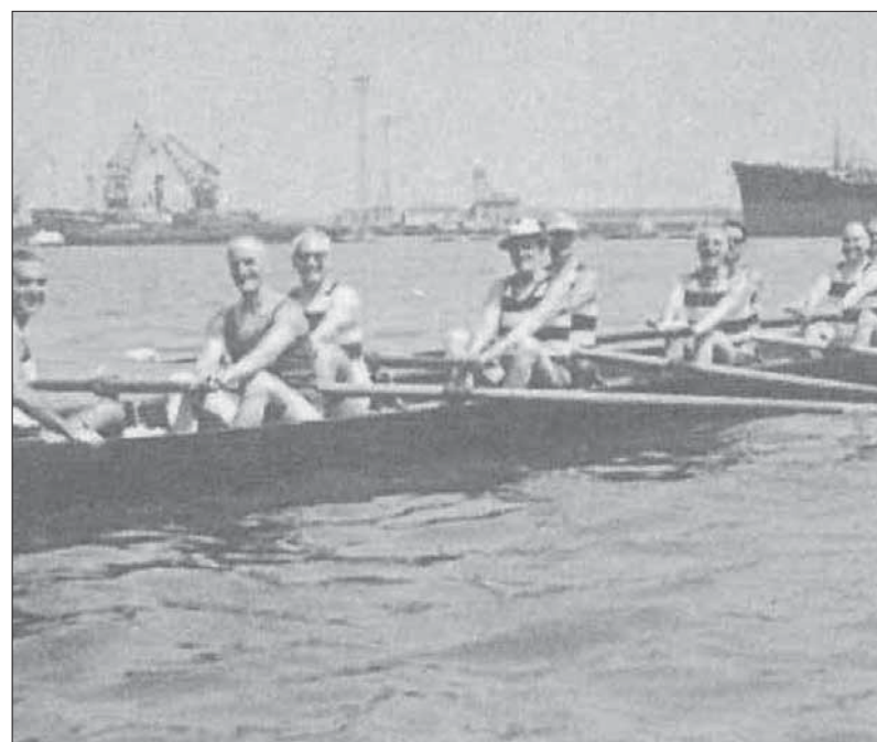
Ancona, la prima uscita della rinata Diadora

tro. E su una "monotopo" il gagliardetto sociale.