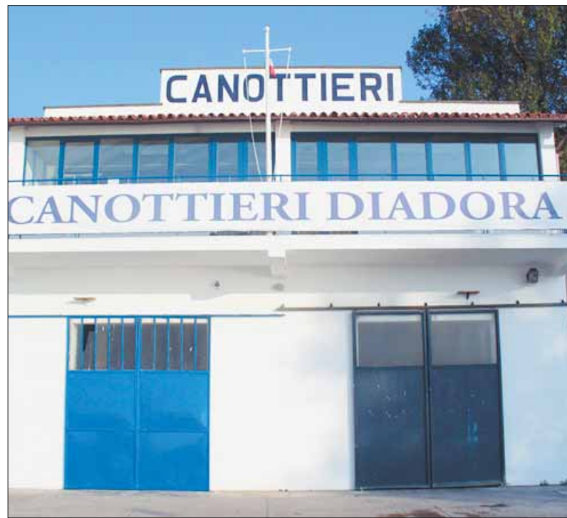
La sede della Diadora oggi