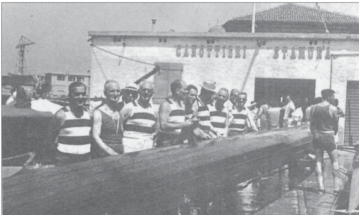
I preparativi per la rinascita del 1961