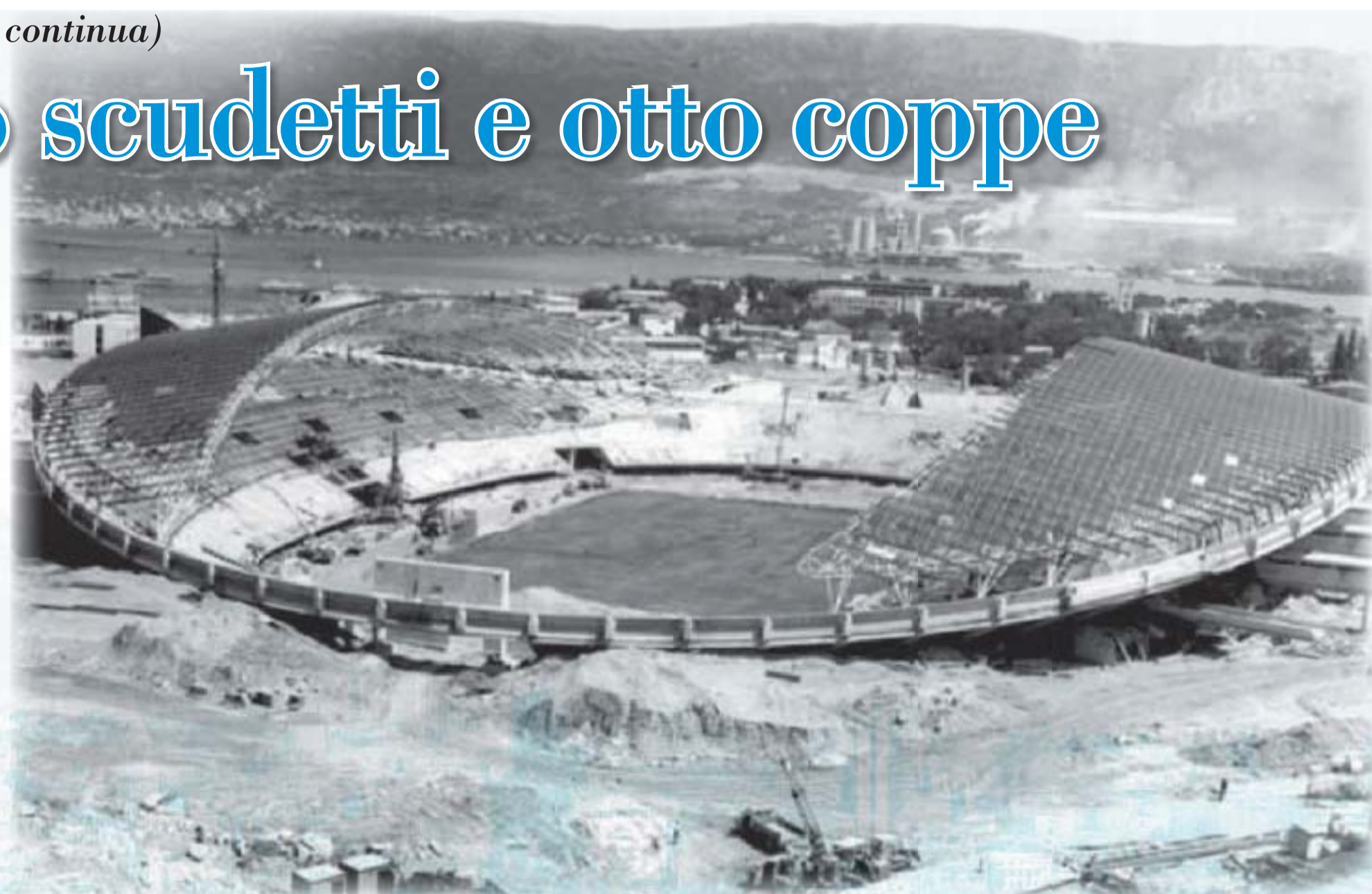
L'attuale stadio di Poljud completato nel 1979 in occasione dei Giochi del Mediterraneo

Seguirono anni trascorsi nei "piani alti" con i dalmati sempre tra i primi cinque in classifica. Erano pochi i punti di distacco dal vertice, ma pur sempre sufficienti per escludere gli spalatini nelle ultime giornate dalla lotta per lo scudetto. Tutto fino al 1986/87 e al famoso campionato delle penalità di sei punti inflitte a ben