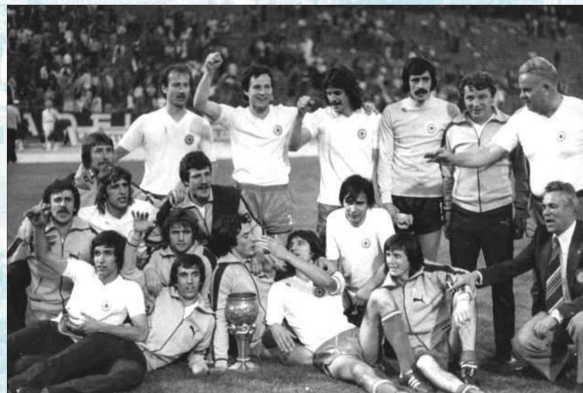
Negli anni '70 ben cinque coppe Jugoslavia furono vinte di fila

Il proverbio dice che non c'è due senza tre. L'antico adagio però non valse per l'Hajduk. Nella stagione 1975/76 ci fu una nuova lotta a due con il Partizan di Belgrado da anni ormai in ombra. Le due squadre passarono tutta la primavera al vertice scambiandosi al primo posto. Lo scudetto fu perso all'ultima giornata! A Belgrado contro l'OFK non bastò la rete