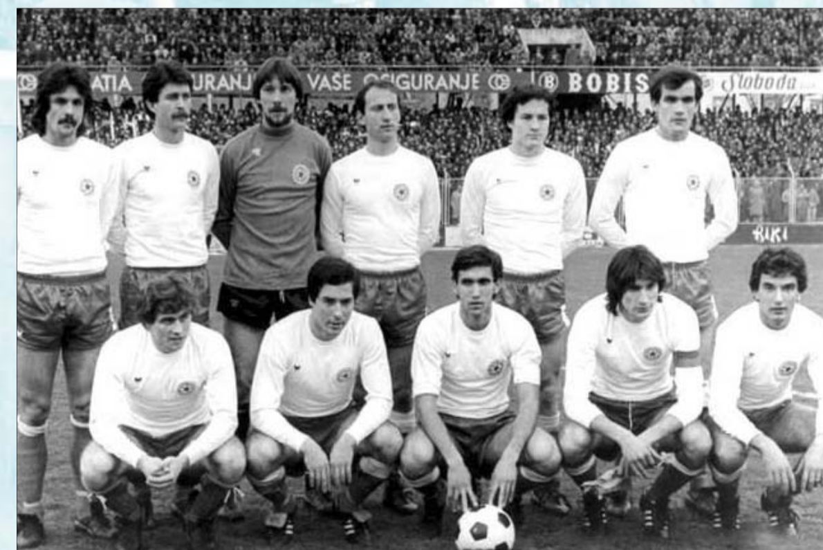
La formazione vincitrice del campionato nel 1979

Se gli anni '60 erano stati durissimi per i tifosi dell'Hajduk, alle porte c'erano gli anni '70, anni di grandi successi su tutti i fronti. Gli ultimi tre campionati degli anni '60 facevano presagire che le aspirazioni di puntare al vertice potevano di nuovo farsi strada. Ormai la squadra era rinata, mancavano solamente la costanza e la compattezza necessarie per vincere finalmente il campionato.