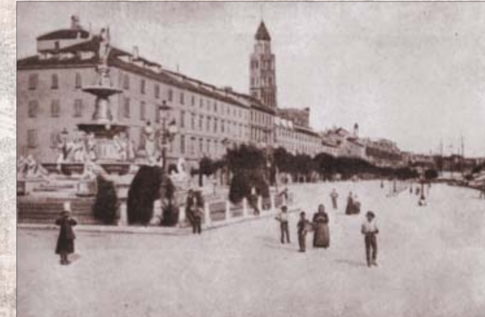
Spalato in una cartolina del 1911, anno di nascita dell'Hajduk