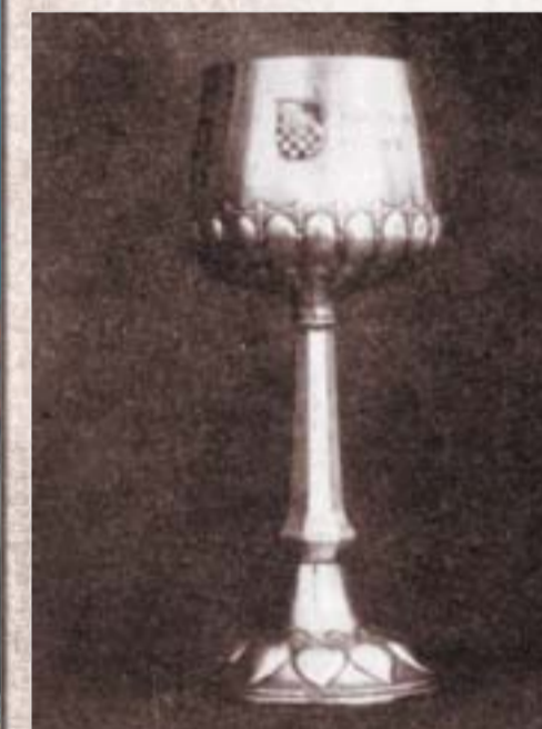
Il primo trofeo dell'Hajduk. In realtà è un trofeo ricordo dato dall'HSK di Zagabria durante la sua prima trasferta a Spalato

ben 160 minuti! Un giornale dell'epoca scrisse che l'incontro attirò molti curiosi e si svolse in tutta tranquillità, senza incidenti di sorta. Unico neo, la durata della partita che affaticò più del dovuto sia i giocatori, sia gli spettatori. Il risultato finale 7-0 la dice lunga su quanto più forte fosse la squadra "A".