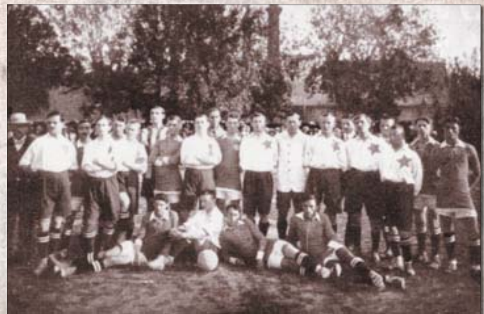
Una delle più forti squadre dell'epoca, lo Slavia di Praga, a Spalato