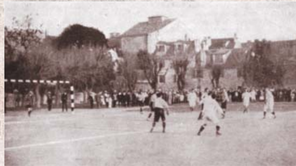
Una delle prime partite. Era il 1911

no dopo il riconoscimento i fondatori si trovarono davanti al rifiuto dei vertici militari di concedere un campo di calcio dove giocare e allenarsi. Questo diniego non sorprese molto i fondatori visto che a Spalato non era ben visto il loro collegamento con Praga. Un fatto più politico che altro. Per questo l'Hajduk ritirò subito la sua domanda di affiliazione alla Federcalcio di Vienna, alla quale la Dalmazia faceva capo. Sulla decisione pesava la posizione di Vienna che condizionava il riconoscimento della società al divieto di giocare con le squadre della Cecchia.