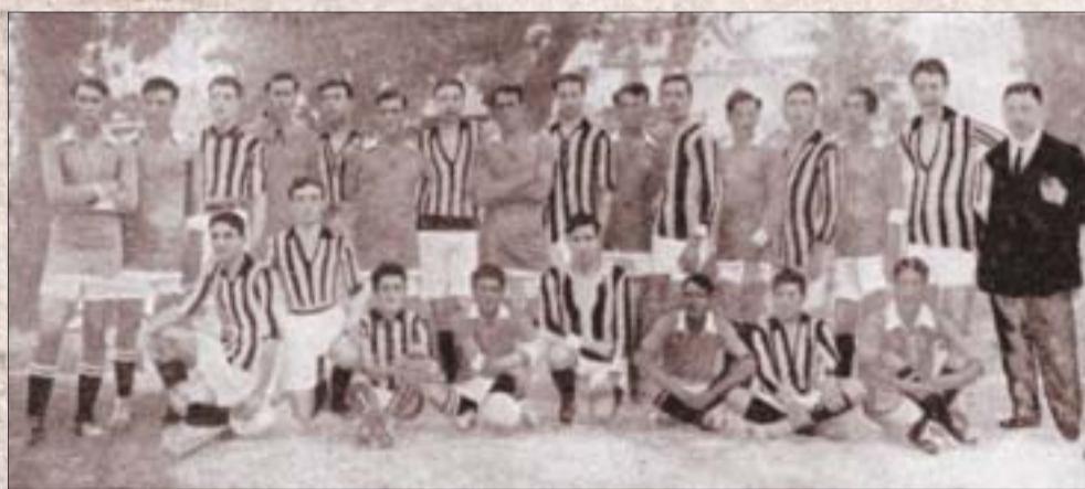
La prima partita internazionale l'Hajduk l'ha giocata nel 1913 contro il Vicenza

salto nel suo ufficio con la "domanda chiave". Il professore non ebbe dubbi nel coniare il nome. Disse: "Siete entrati senza bussare, dritti dentro, come dei veri 'hajduci'. Ecco-