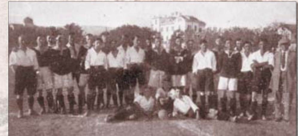
I giocatori dell'Hajduk con i cecchi dello Sparta Praga nell'ultima partita disputata alla vigilia della prima guerra mondiale

Al fischio finale della seconda partita con lo Sparta iniziarono gli anni bui per l'Hajduk. Mentre l'incontro era in corso venne ordinata la mobilitazione per la prima guerra mondiale. Gli agenti, appena finita la partita, entrarono sul terreno di gioco e prelevarono gran parte dei giocatori inviandoli al fronte. La società venne chiusa e il primo campo di calcio dell'Hajduk venne trasformato in campo per prigionieri di guerra.