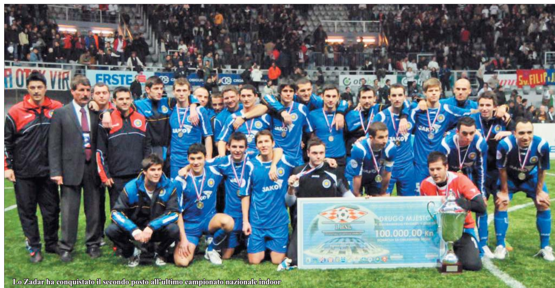
Lo Zadar ha conquistato il secondo posto all'ultimo campionato nazionale indoor