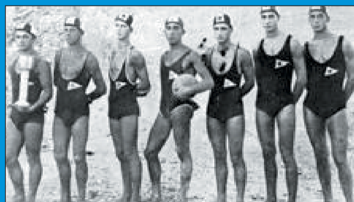
Una delle prime squadre

Il mare e la Dalmazia vivono da sempre in simbiosi. Anche se il nuoto e la pallanuoto non sono necessariamente "vincolati" alle realtà costiere (come non ricordare, ad esempio, i clamorosi successi dell'Ungheria in questo sport) è indubbio che in riva all'Adriatico orientale tutto quello che riguarda l'acqua non può passare in secondo piano. Scrivere della vita sportiva a Spalato, come del resto praticamente in tutta la Dalmazia, senza menzionare il mondo del nuoto e della pallanuoto è praticamente impossibile. Ormai questi sport a Spalato vantano una tradizione centenaria. La pallanuoto spatatina, in particolare, si fregia di una storia piena, zeppa, di importanti personaggi che ne hanno segnato il percorso in maniera indelebile. Passiamoli in rassegna assieme a quelli che hanno segnato la storia del nuoto nel capoluogo dalmata.