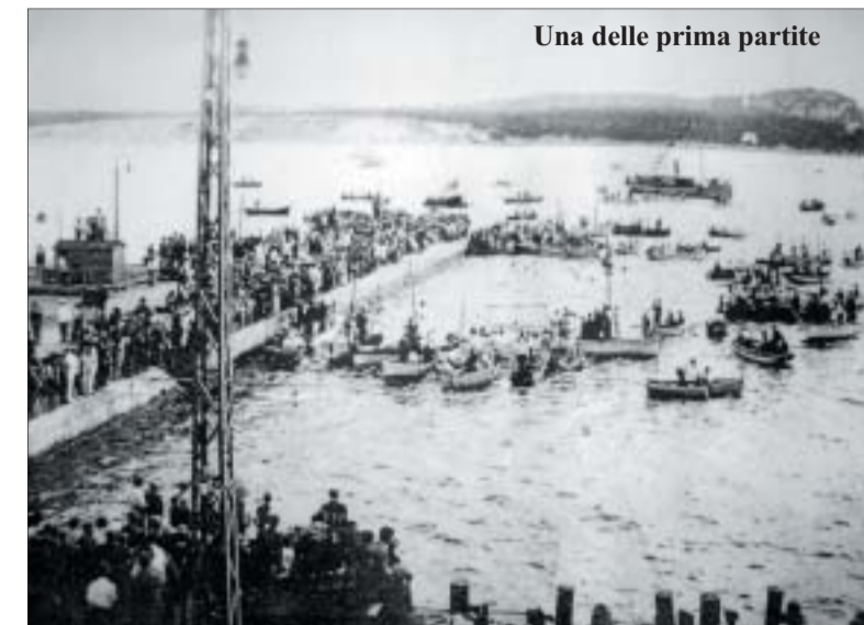
Una delle prime partite