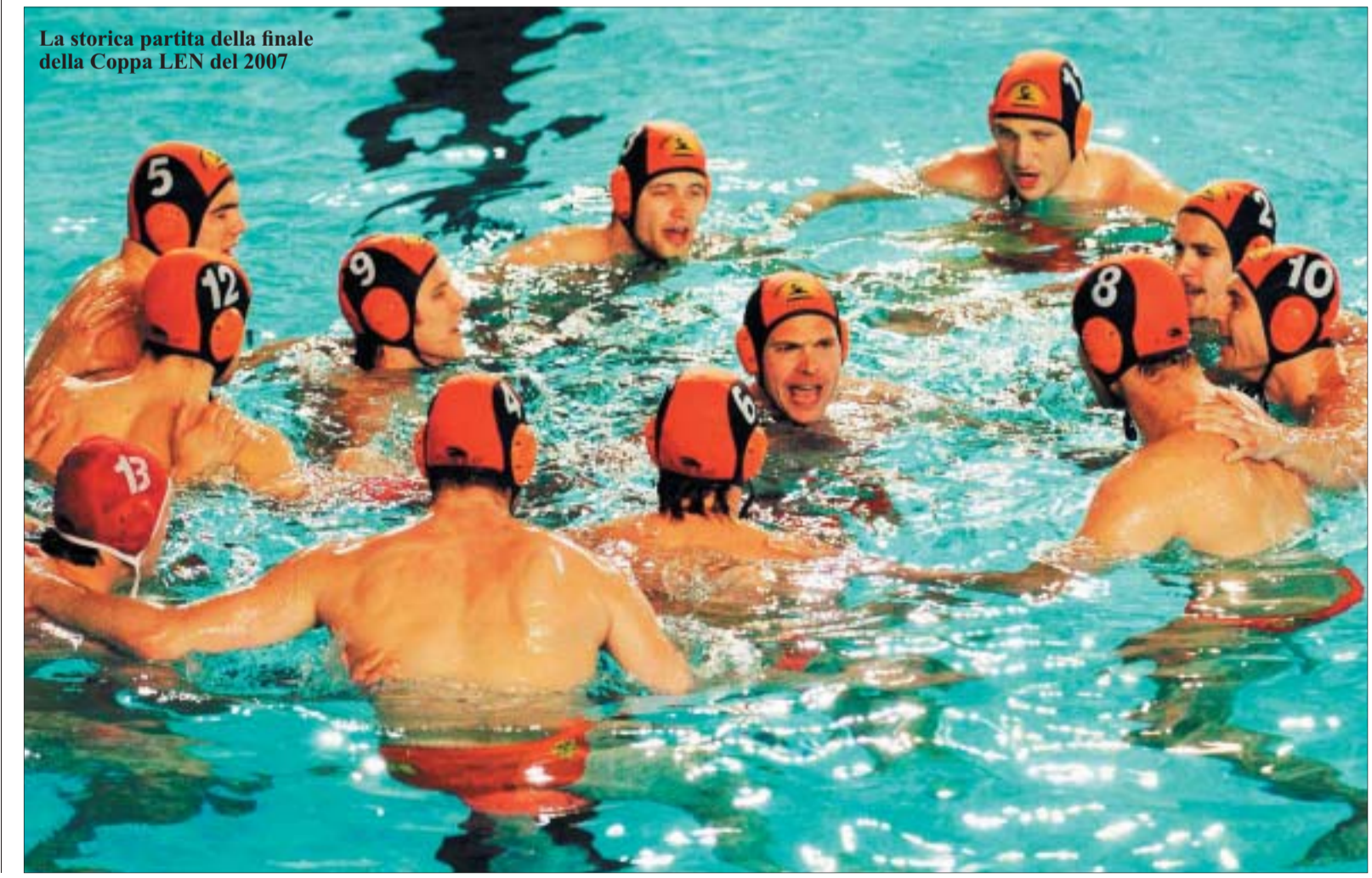
La storica partita di finale della Coppa LEN del 2007