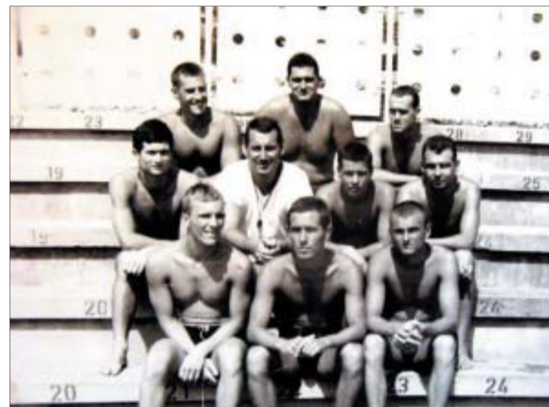
La squadra del 1962