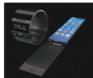
Samsung Galaxy Gear