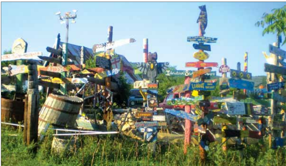
La «selva» di totem testimonia il passaggio al Santuario di volontari di tutto il mondo