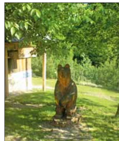
Gli orsi sono il simbolo di Kuterevo

foreste. Un habitat ideale per la proliferazione del regno animale. Nel tentativo di fronteggiare il problema degli "orsacchiotti vagabondi", dando loro una mano a sopravvivere, nella cittadina di Kuterevo è stata creato un "orfanotrofio" molto particolare: il Santuario degli orsi.