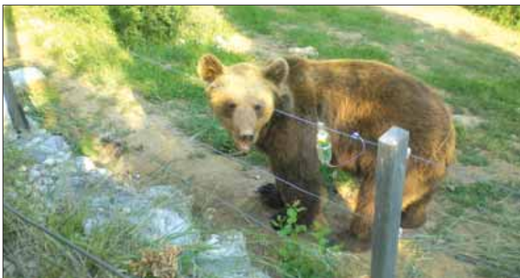
Gli orsi attirano in Lika 20mila turisti l'anno

Il problema dei piccoli orsi, abbandonati o persi nelle foreste, è molto frequente in Lika. Una regione in gran parte disabitata e ricoperta di