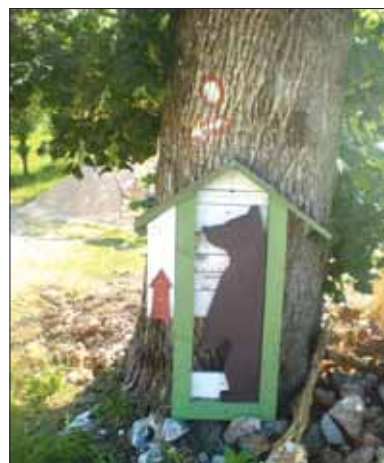
Un'indicazione a immagine di plantigrado