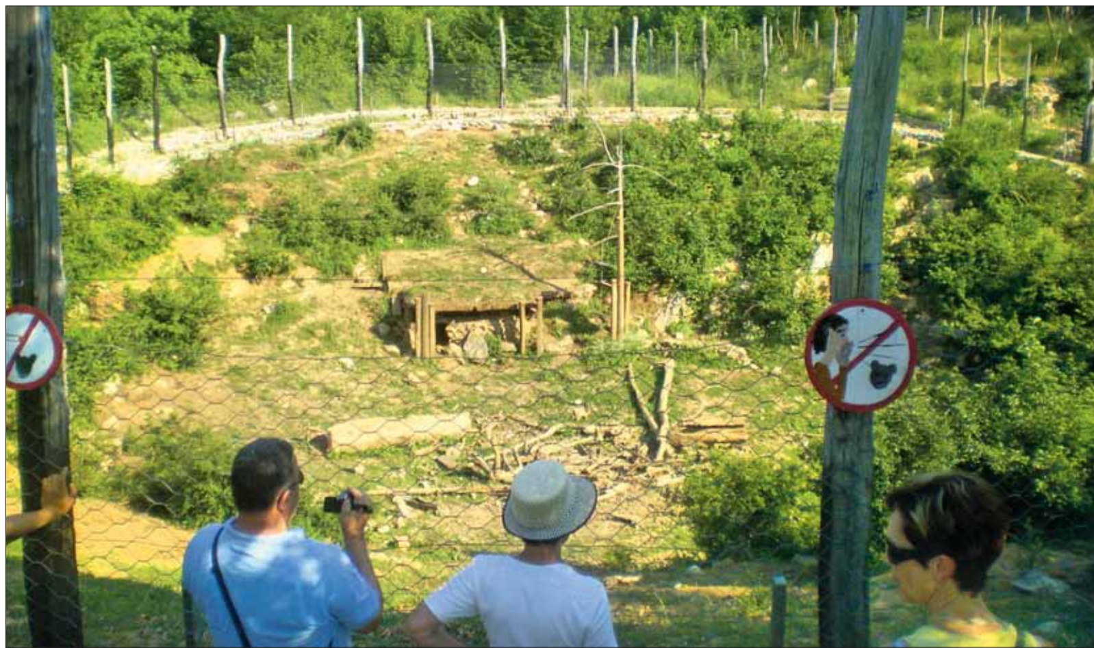
Il recinto principale del Santuario