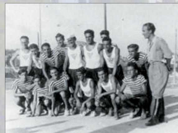
Un attimo della prima partita di pallacanestro tra il GIL e la GUF

sport inevitabilmente ha pagato il suo prezzo. Nei primi giorni si è arrivati alla fondazione del GIL: Gioventù Italiana Littorio, organizzazione in primo luogo per le ultime classi della scuola elementare. Così tra le prime partite sportive organizzate a Spalato troviamo una partita di pallacanestro disputata il 26 luglio 1941 dove il GIL prevalse contro il GUF per 49:25. Molta resistenza al cambio di potere fu opposta da canottieri e nuotatori. Con l'arrivo di Bastianini a Spalato venne organizzata una manifestazione di canottaggio boicottata però dalla squadra locale dell'HVK e una di nuoto che vide il rifiuto dei nuotatori della Jadran di parteciparvi. Quest'ultima manifestazione alla fine fu annullata.