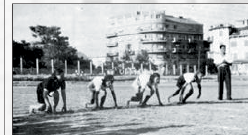
Durante il 1945 sul campo dell'Hajduk si sono disputate svariate gare di atletica