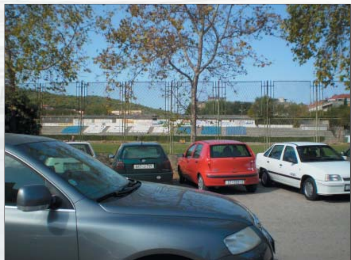
Il vecchio campo dell'Hajduk condannato alla demolizione

Anche se la fusione finale si ebbe alla fine del 1947 questa non durò a lungo. Infatti dopo un solo anno di "comunione dei beni" si decise di procedere alla formazione di organi dirigenziali indipendenti per i singoli sport. E poi, alla fine del 1949, ebbe luogo il nuovo smembramento con la conseguente rifondazione delle singole società sportive man mano che uscivano dalla polisportiva.