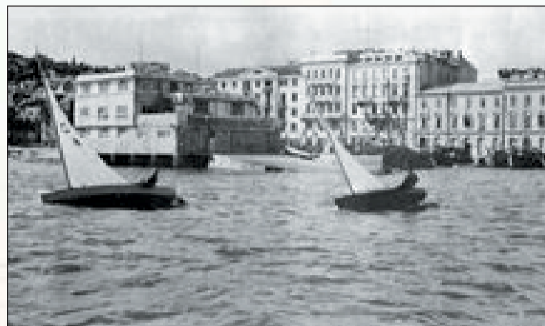
Gara di vela nel porto di Spalato