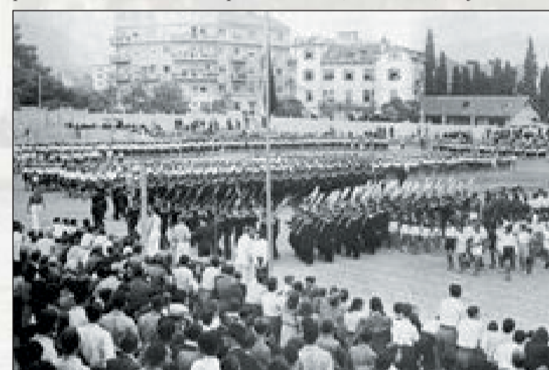
Una delle gare sul vecchio campo dell'Hajduk