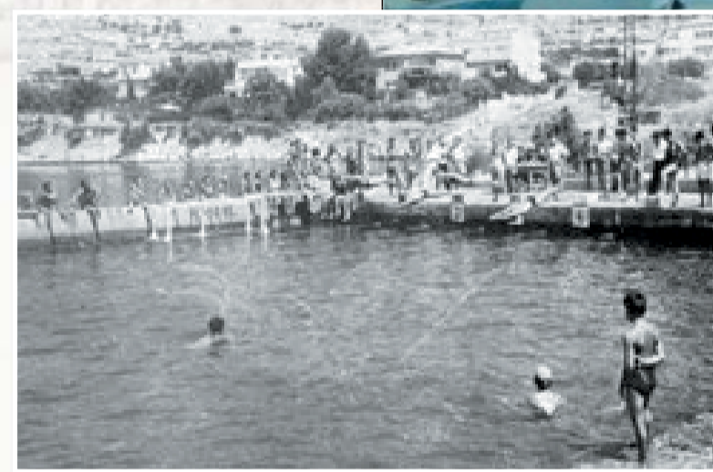
Un allenamento dei pallanuotisti