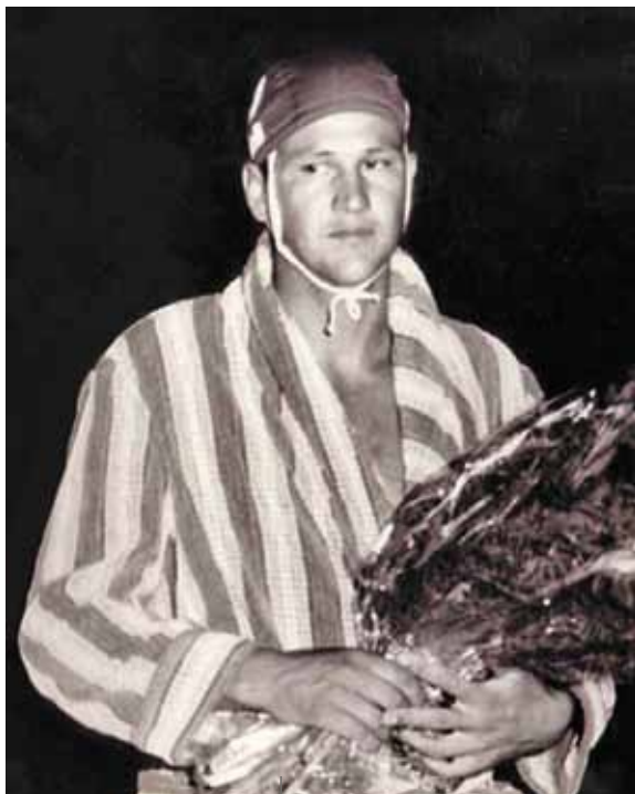
Ivica Cipci, pallanotista medaglia d'argento