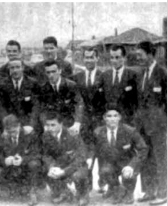
La nazionale della Jugoslavia medaglia d'argento