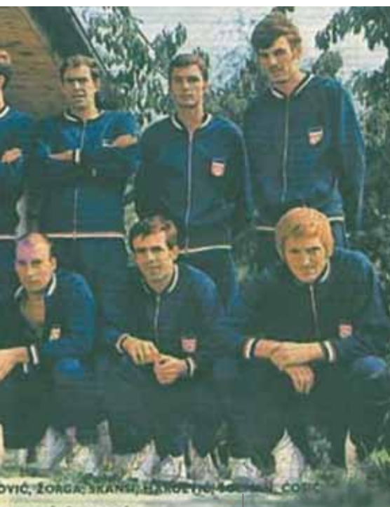
I cestisti d'argento nel 1968