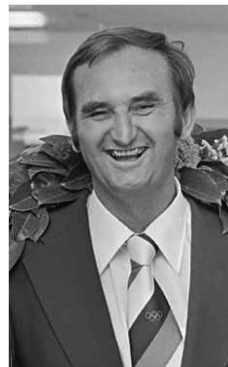
Il forte pallanuotista Ivo Trumbić, argento nel 1964 e oro nel 1968