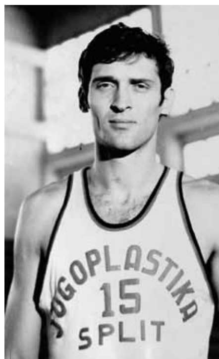
Petar Skansi, argento nel 1968 e futuro grande allenatore