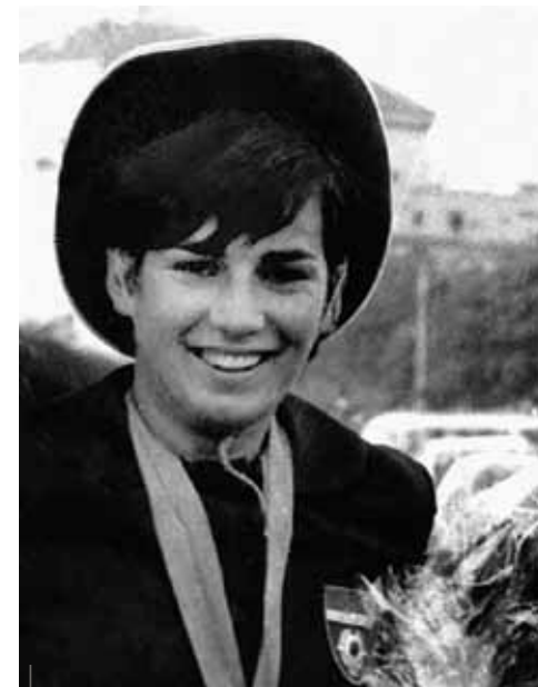
Đurđica Bjedov, la rivelazione nel nuoto alle Olimpiadi del 1968