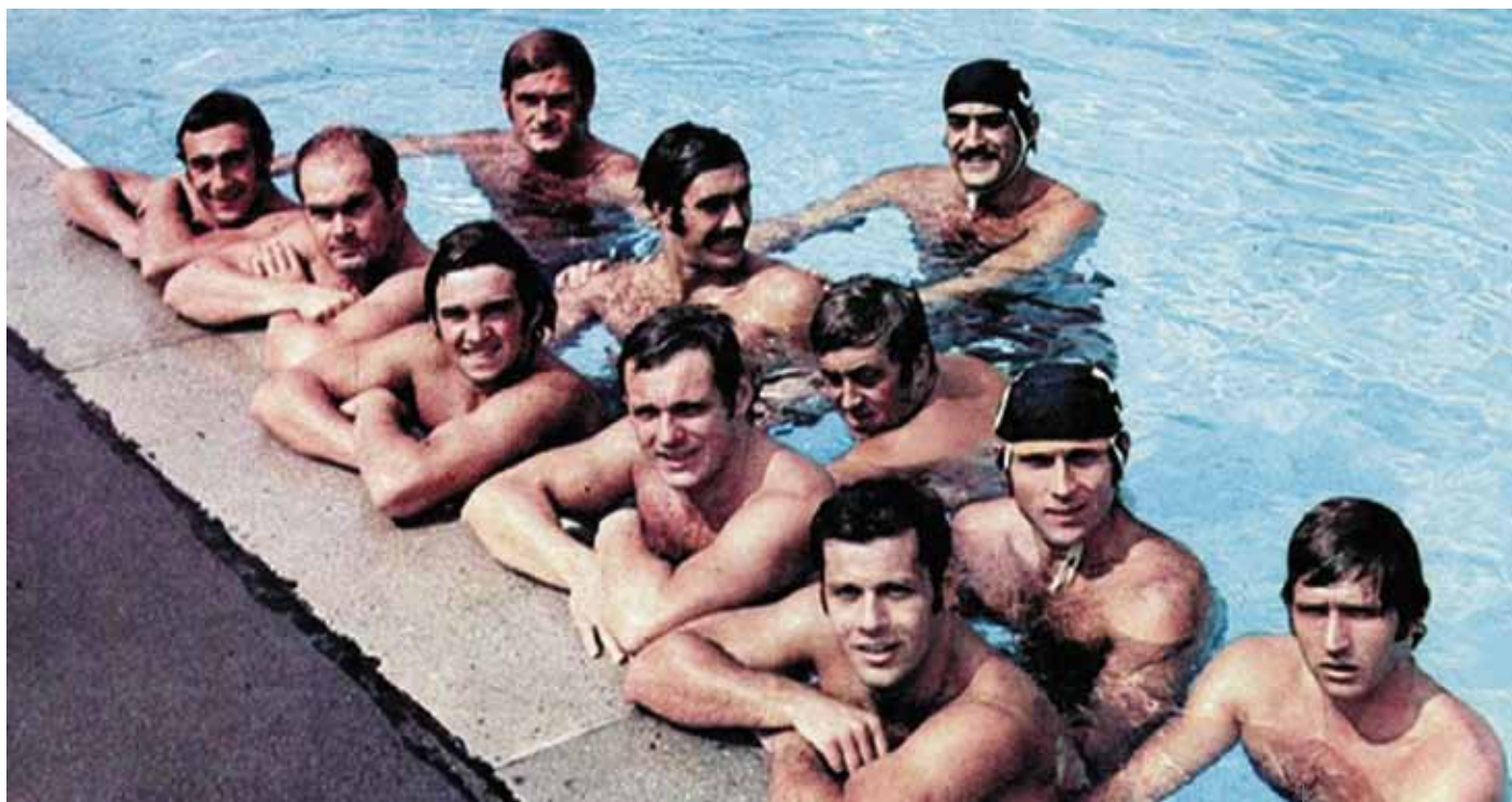
La nazionale di pallanuoto