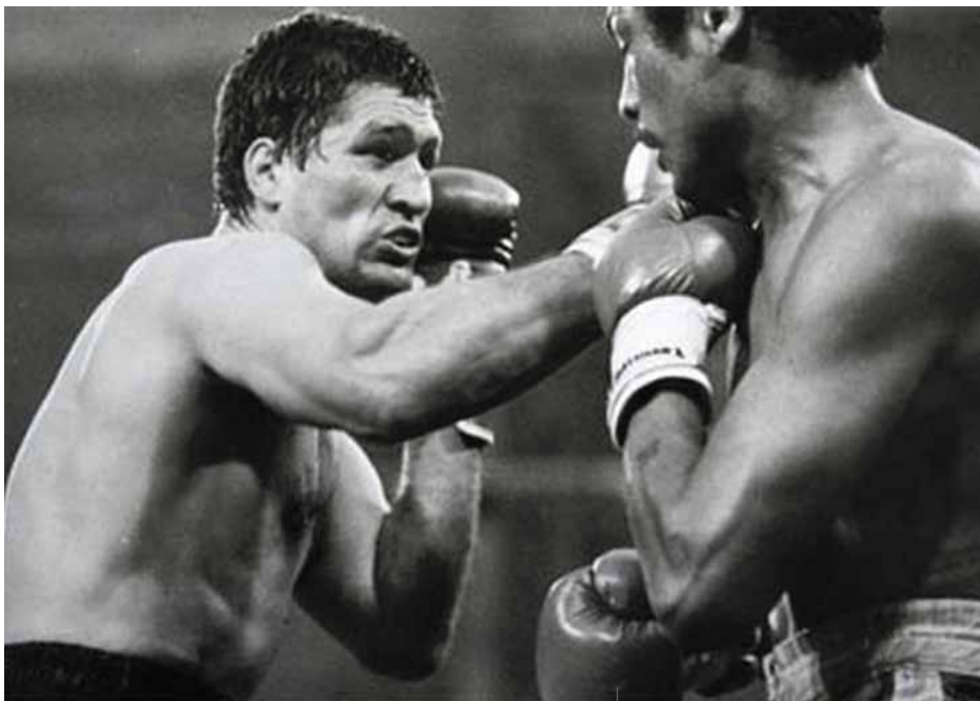
Mate Parlov, con l'oro a Monaco di Baviera inizia la sua ascesa mondiale