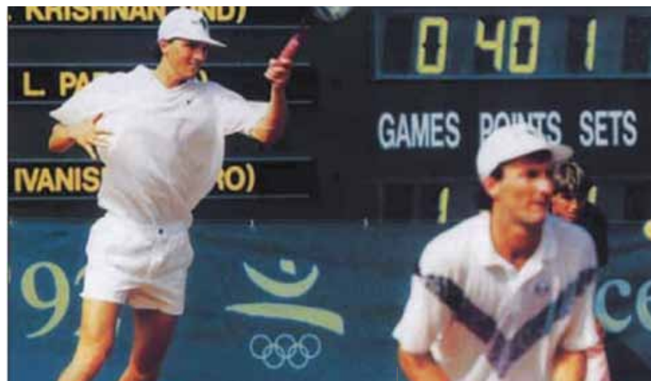
Goran Ivanišević e Goran Prpić, bronzo nel doppio