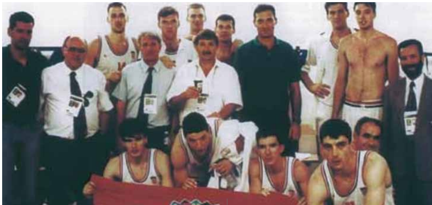
La nazionale di pallacanestro che conquistò a Barcellona una splendida medaglia d'argento

Goran Ivanišević partecipò a quattro Olimpiadi. Esordì a Seoul, dove uscì subito al primo turno nel singolo, mentre nel doppio arrivò ai quarti di finale. Però all'epoca era ancora troppo giovane e con scarsa esperienza. Al contrario a Barcellona arrivò con grandi ambizioni. E per di più il Comitato olimpico nazionale gli concesse l'onore