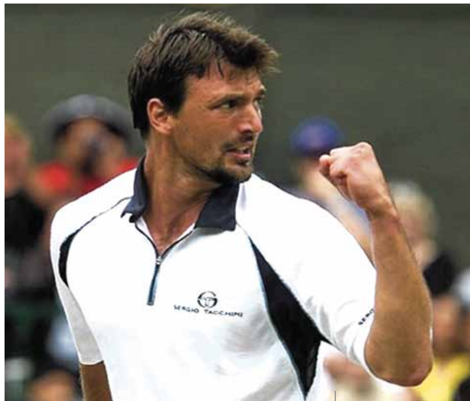
Goran Ivanišević, bronzo nel singolo

Dall'altro lato, Dino Rada, classe 1967, partecipò pure a tre Olimpiadi come Kukoč. Vinse un bronzo mondiale e due ori, nonché tre bronzi europei. Più modesta fu la sua carriera in terra americana. Tre gli zaratini presenti a Barcellona: Arijan Komazec, Alen Gregov e Stojko Vranković (quest'ultimo comunque nato a Drniš, nell'entroterra dalmata). Komazec può vantare nel suo carnet la presenza a due Olimpiadi, nonché due medaglie ai Mondiali e tre agli Europei. Inoltre da registrare una breve avventura nell'NBA. Più lunga invece la presenza negli Stati Uniti d'America di Stojko Vranković. Egli aveva