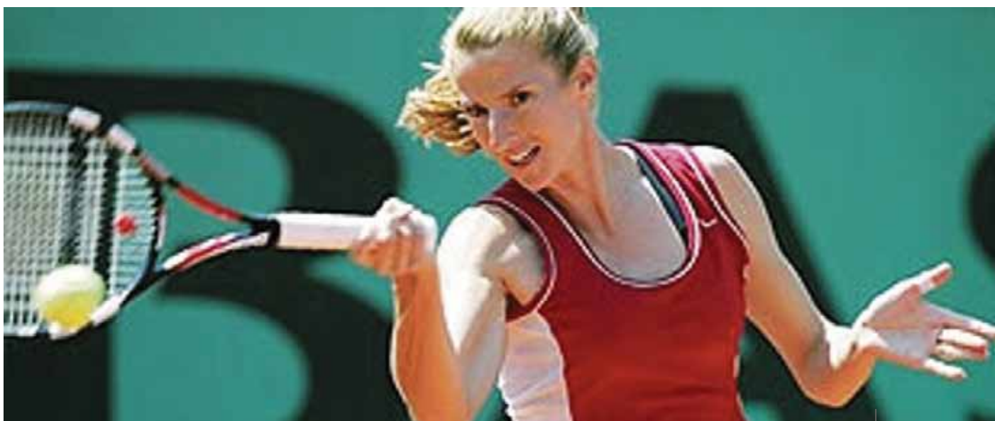
La tennista Silvia Talaja