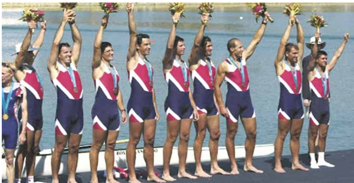
Lo splendido otto con, medaglia di bronzo

ultimi secondi. A vincere fu l'equipaggio del Regno Unito davanti all'Australia. La Croazia giunse terza con meno di due secondi di ritardo. Mezzo secondo dopo arrivò l'imbarcazione italiana.