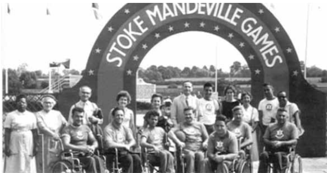
I partecipanti ai primi Giochi di Stoke Mandeville

Quattro anni dopo, i migliori atleti con disabilità si riunirono a Toronto. A quell'edizione dei POI parteciparono 1.600 atleti in rappresentanza di 38 Paesi. Furono i primi Giochi Paralimpici a finire sotto