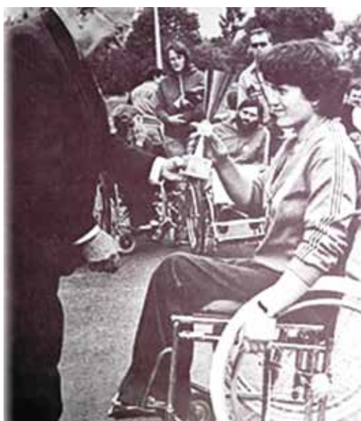
Ludwig Guttman e Milka Milinković